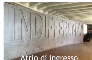
Atrio di ingresso

Liliana Segre, da pochi giorni senatrice a vita, nel suo Sopravvissuta ad Auschwitz scrive: