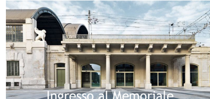
Ingresso al Memoriale

Immagini tratte dal Memoriale della Shoah di Milano.