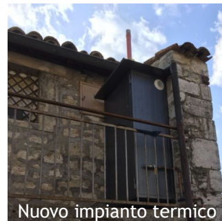
Nuovo impianto termico